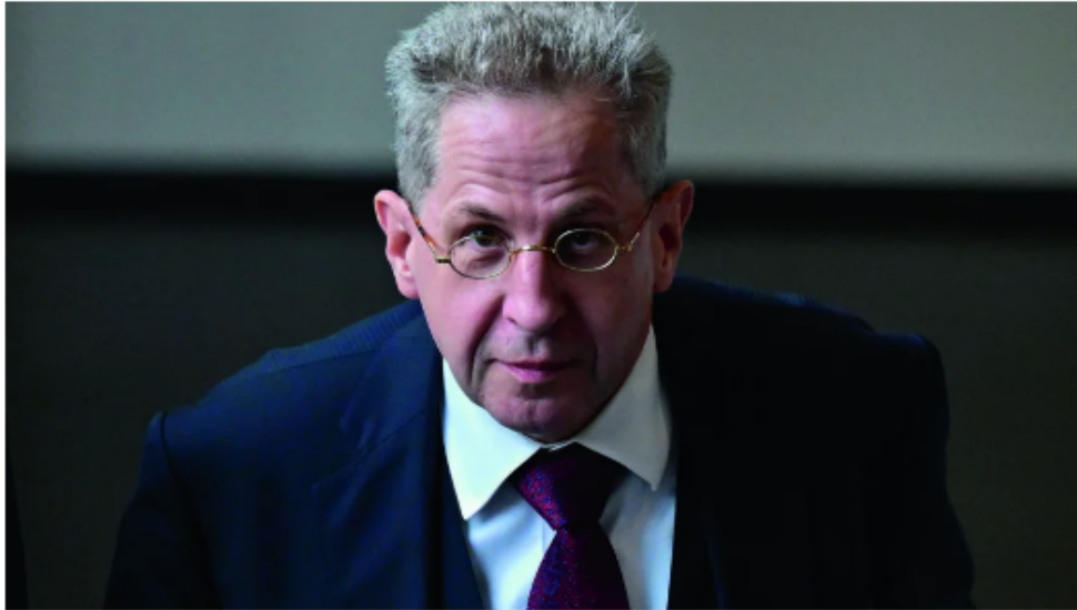
MARTIN SCHUTT / KEYSTONE

Ein äusserst subversiver Witz: Parteigründer Maassen.