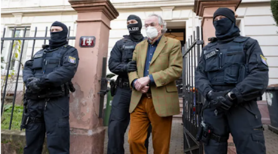
Heinrich XIII. Prinz Reuß wird am 7. Dezember 2022 in seiner Frankfurter Wohnung festgenommen und abgeführt