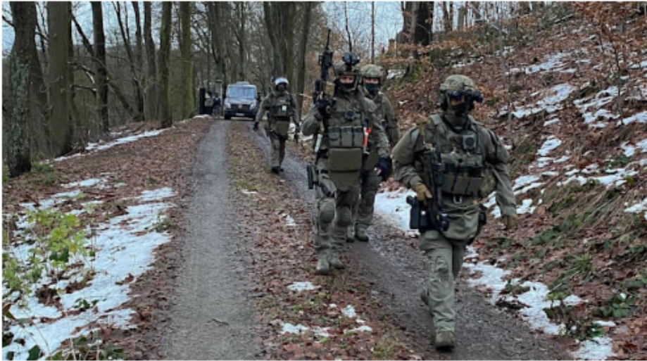
BKA-Beamte, Spezialeinheiten wie die GSG 9 und mehrere SEK rücken im Dezember 2022 zu bundesweiten Razzien aus