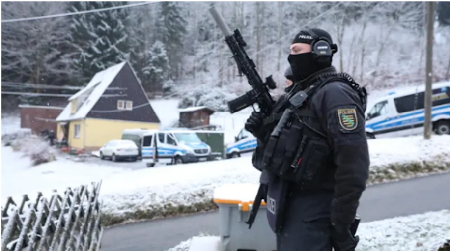
Schwer bewaffnet sichert im Rahmen der Razzia ein sächsischer Polizist ein Anwesen im Erzgebirge