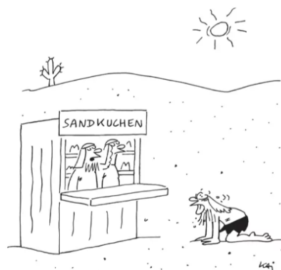
„Und dann hatten wir diese Geschäftsidee...“

Bundeskanzler Scholz ist stolz darauf, dass er die Bundeswehr zur stärksten Armee auf dem Kontinent ausbauen will, und rühmt sich wöchentlich, der Ukraine Waffen zu liefern, mit denen Freiheit und Demokratie verteidigt würden. Er übersieht offensichtlich dabei, wie seine Aufrüstungspläne im westlichen Europa