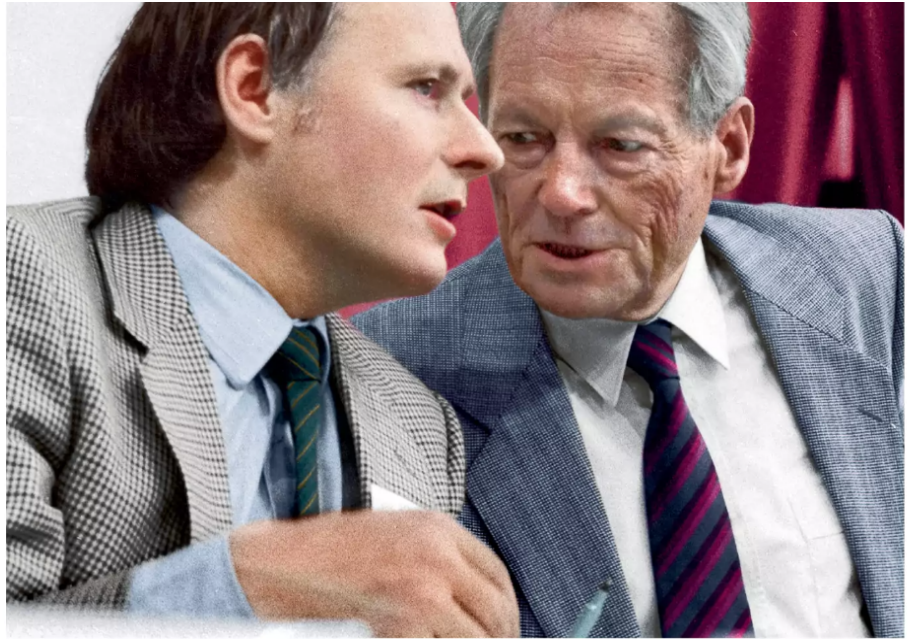
«Krieg ist kein Mittel der Politik»: Nobelpreisträger Brandt, Autor Lafontaine (l.), 1984.

Zur Erinnerung: Gewaltverzicht stand im Zentrum der Ostpolitik Brandts. «Krieg ist kein Mittel der Politik» lautete sein Credo. Dass Sicherheit nur gemeinsam und nicht gegeneinander zu erreichen sei, haben Brandt und Bahr immer wieder gesagt. Abrüstung, nicht Aufrüstung, war damals und wäre heute für den Friedensnobelpreisträger der Weg zum Frieden. Wenn man sieht, dass die sozialdemokratische Verteidigungsministerin Christine Lambrecht F-35-Kampfflugzeuge aus den USA bestellen will, um die «atomare Teilhabe Deutschlands» sicherzustellen, dann könnte man zynisch werden und auf die Idee kommen, vorzuschlagen,