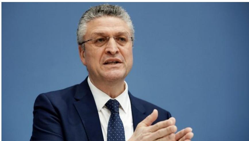
Lothar H. Wieler, Präsident des Robert Koch-Instituts (RKI)

Das Robert Koch-Institut hat einen Bericht der „Bild“-Zeitung über Äußerungen seines Präsidenten Wieler zu Covid-Patienten mit Migrationshintergrund richtiggestellt. Die „Bild“ hatte aus einem informellen Gespräch Wieliers mit Medizinern berichtet, unter anderem über überdurchschnittlich viele Covid-Patienten mit Migrationshintergrund. Die Gründe dafür sind vielfältig.