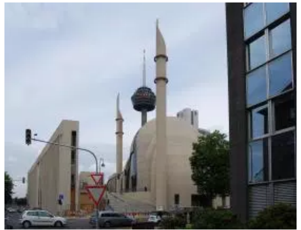
BILD: Große Moschee mit Minarett in Köln-Ehrenfeld

Der Muezzinruf im Wortlaut: Beim Gebetsruf (Adhan) werden nach dem viermaligen Takbir beide Teile der Schahada, eingeleitet mit aschhadu an bzw. anna? „Ich bezeuge, daß ...“, jeweils zweimal gesprochen. Die Schahada im Adhan lautet: „Aschhadu an la ilaha illa ‘llah (zweimal). Aschhadu anna Muhammadan rasulu ‘llah (zweimal). Hayya’ala s-salat (zweimal). Hayya ‘ala al-falah“ (zweimal).